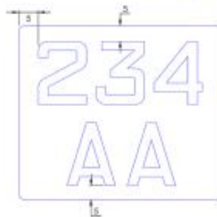
תמונה מס' 6

6.4. במקרה בו האותיות או המספרים מוצגים בשתי שורות, הרווח בין המספרים בשורה העליונה, לאותיות בשורה התחתונה, יהיה 5 מ"מ, כמודגם בתמונה 7 להלן: