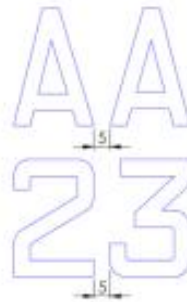
תמונה מס' 5

6.3. המרווח בין השוליים לבין כל אות או מספר הקרובים ביותר לראש, תחתית או הצדדים של לוחית הזיהוי, לא יפחת מ-5 מ"מ, כמודגם בתמונה 6 להלן.