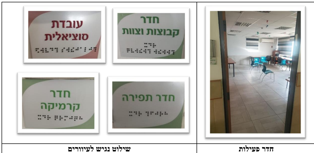
שילוט נגיש לעיוורים