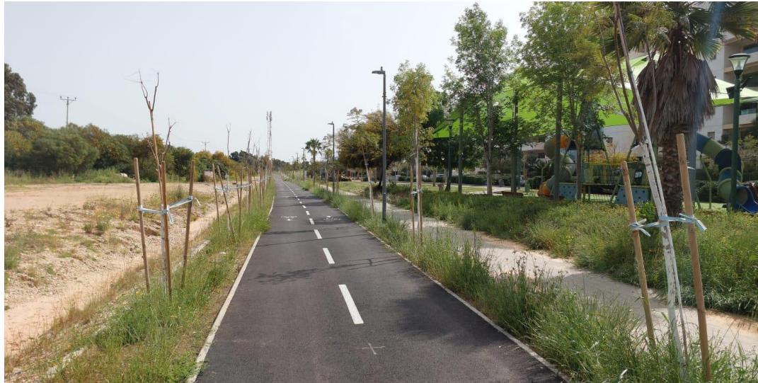
פרויקט: אופני דן