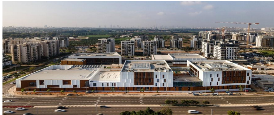
פרויקט : קריית חינוך שמעון פרס (גליל ים ב' מגרש 406)